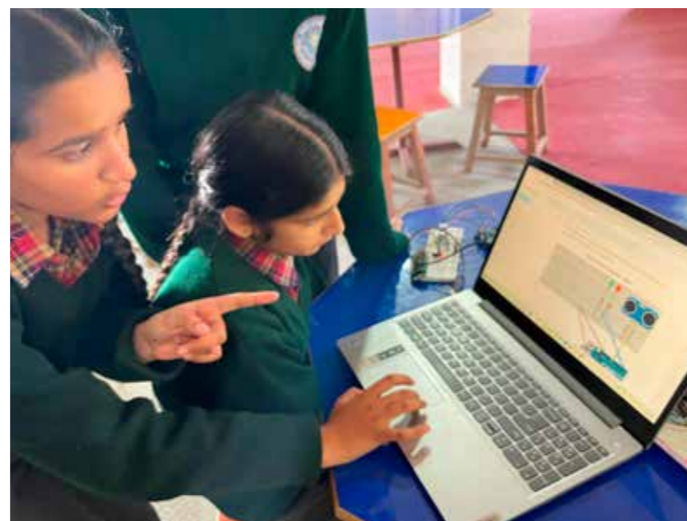
En Inde, des adolescents sont incités à trouver des solutions aux problématiques quotidiennes pour développer leurs capacités créatives (Partenaire ASED - PYDS)