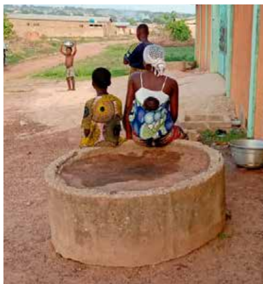
Au Bénin, l'eau potable a été amenée à l'école La Segoviana. Par la même occasion, un robinet a été installé à l'extérieur, dans la rue, à la disposition des habitants du quartier

ASED souhaite accompagner les enfants et les jeunes afin qu'ils soient à l'aise en toute situation, qu'ils sachent s'adapter aux changements à venir et qu'ils deviennent des acteurs actifs de leur société.