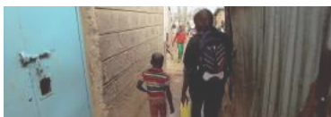
Little Big Steve, manifeste en faveur des droits de l'enfant