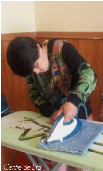
Centre de Lira

D'un point de vue de la sensibilisation, l'idée agogique n'est pas encore toujours acquise. Les directeurs doivent encore intégrer l'importance de fournir des prestations professionnelles de haute qualité et notamment de travailler pour une clientèle extérieure ouvrant ainsi l'institution vers la société.