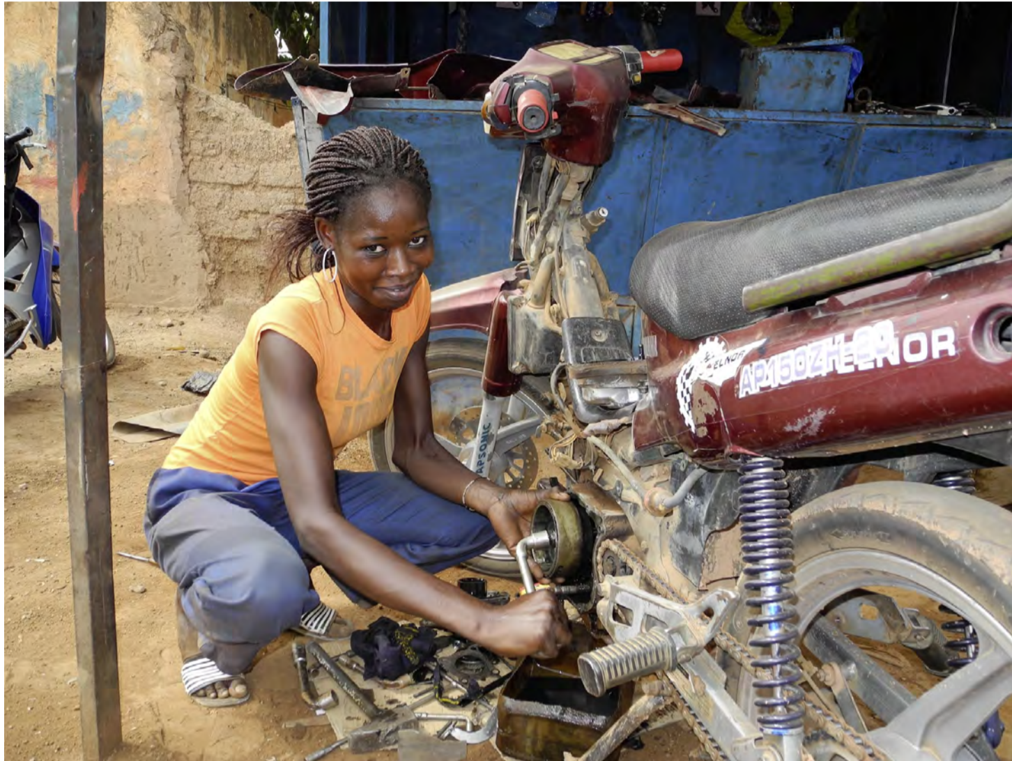
À Ouagadougou, au Burkina Faso, une jeune fille pratique le métier de mécanicienne, appris dans un centre de formation de l'association AT-Tous, partenaire de Terre des Hommes Suisse. Terre des Hommes Suisse

Au Mali comme au Burkina Faso, ces jeunes incarnent la vitalité des filières de formations professionnelles soutenues par la coopération au développement. Si certains ONG, comme AccEd ou Terre des Hommes Suisse, toutes deux membres de la Fédération genevoise de coopération (FGC), mènent de longue date des projets dans ce domaine, l'éducation a bénéficié d'un regain d'attention depuis l'adoption de l'Agenda