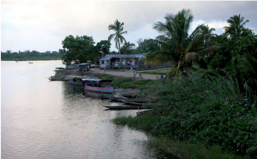
À Nosy Varika, l'ASED construit une troisième classe, grâce à vous.