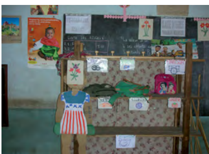
Assurons-leur ensemble un avenir grâce à notre soutien scolaire à Tananarive.

alarmant, le plus souvent causé par la malnutrition et les problèmes de santé. Ainsi se poursuit le cercle vicieux de la pauvreté, celui que nous voulons rompre, justement.