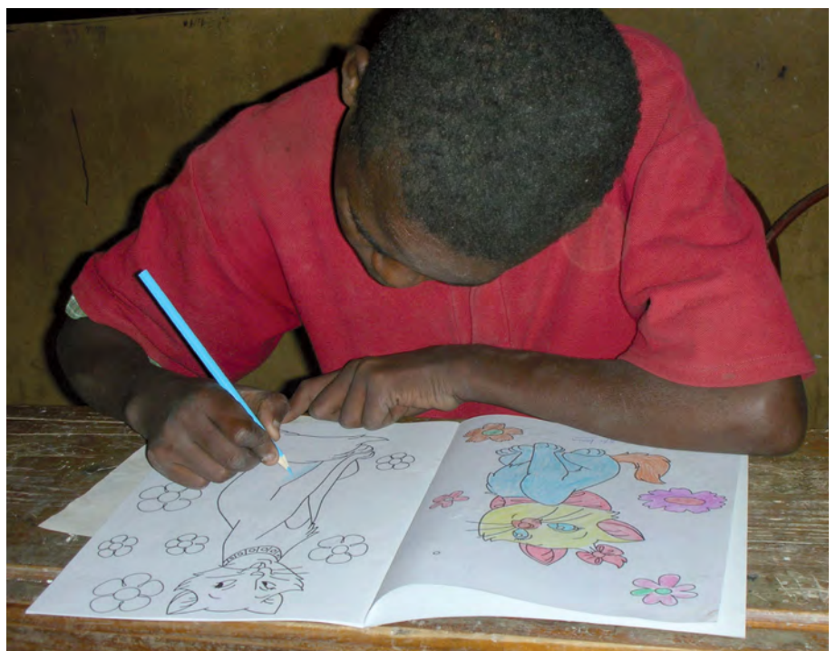
Apprendre à lire et à écrire : un travail quotidien que l'ASED s'efforce de soutenir à Madagascar.