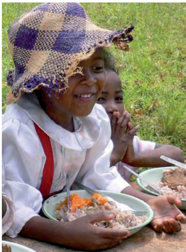
En 2009, cette petite Malgache a continué à pouvoir se nourrir grâce à votre générosité.